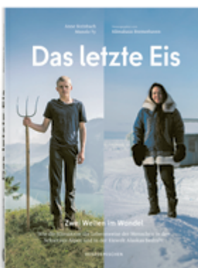
Klimahaus Bremerhaven Das letzte Eis