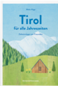
Mela Hipp Tirol für alle Jahreszeiten