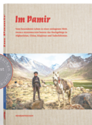
Priska Seisenbacher Im Pamir