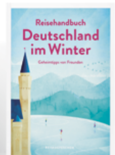
Geheimtipps von Freunden Deutschland im Winter