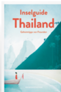
Geheimtipps von Freunden Inselguide Thailand