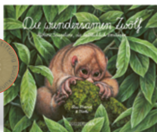
Rae Mariz und Moki Die wundersamen Zwölf