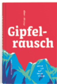
Philipp Laage Gipfelrausch