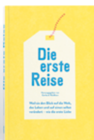
Hrsg. v. Gerhard Waldherr Die erste Reise