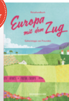
Cindy Ruch Europa mit dem Zug