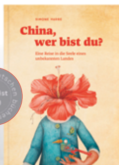
Simone Harre China, wer bist du?